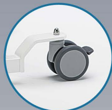
Ø 100 mm Kunststoff-Edelstahl-Doppelradrollen (2 mit Feststeller)