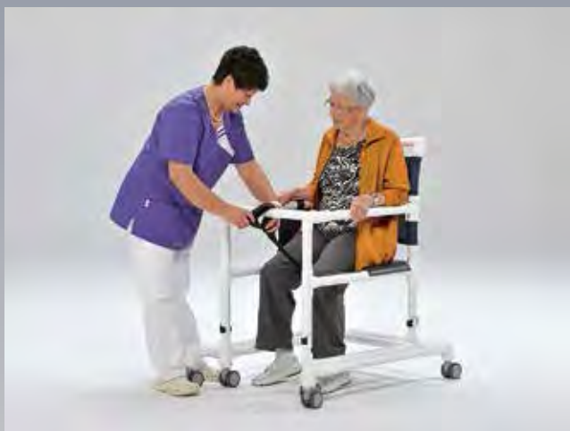
Attacher la ceinture de sécurité tendue à la barre de sécurité