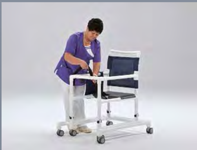
Ouvrir la ceinture et la barre de sécurité

Quelques gestes simples suffisent pour régler le déambulateur individuellement au besoin de chaque utilisateur.