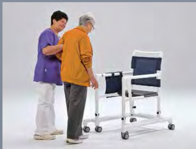
Aider l'utilisateur à s'installer