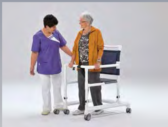
Faire les premiers essais accompagné de personnel professionnel