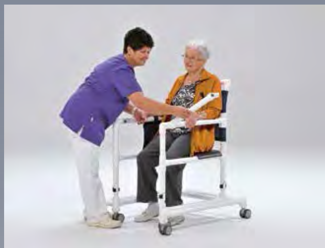
Fermer la barre de sécurité à l'aide du loquet