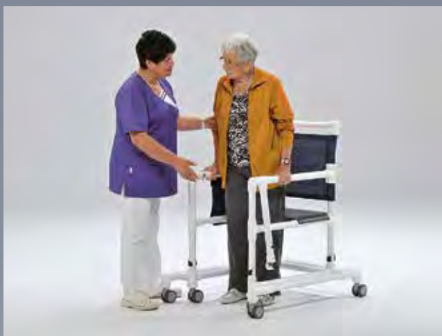
Régler la hauteur par rapport à la taille de la personne