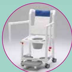
Abnehmbare Sitz- und Rückenpolster