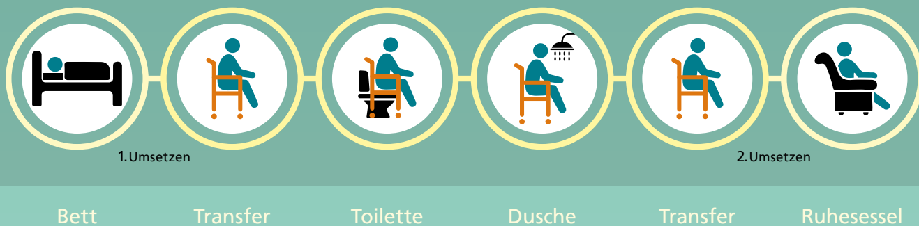
RCN Multifunktions-Dusch- und Toilettenstuhl