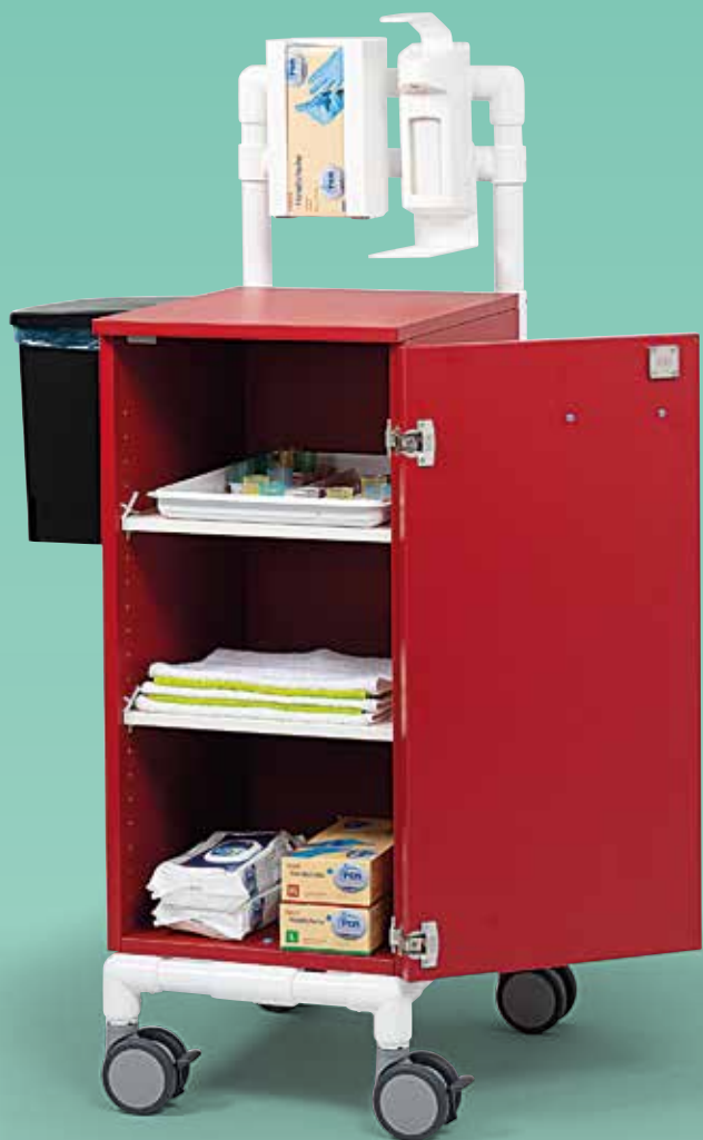
Lieferung ohne Inhalt

Unser Pflegearbeitswagen bietet Ihnen viel Platz für alle Utensilien, die Sie für die tägliche Pflege benötigen. Eine echte Hilfe für Ihre Station.