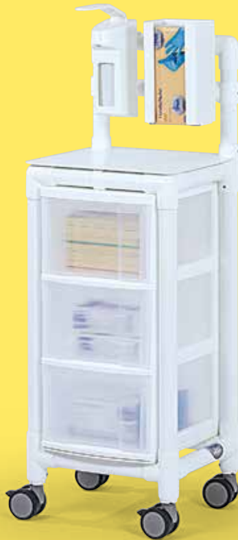
Die abgebildeten Inhalte sind nicht im Preis enthalten.