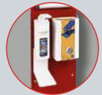
Multifunktionshalterung für Handschuhe