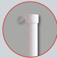
Halterung mit Haken